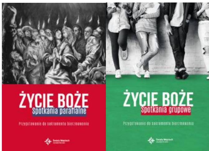
Życie Boże – Spotkania parafialne i grupowe