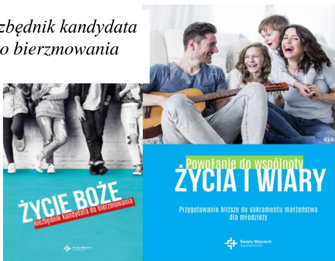
Powołanie do wspólnoty życia i wiary. Przygotowanie bliższe młodzieży do sakramentu małżeństwa